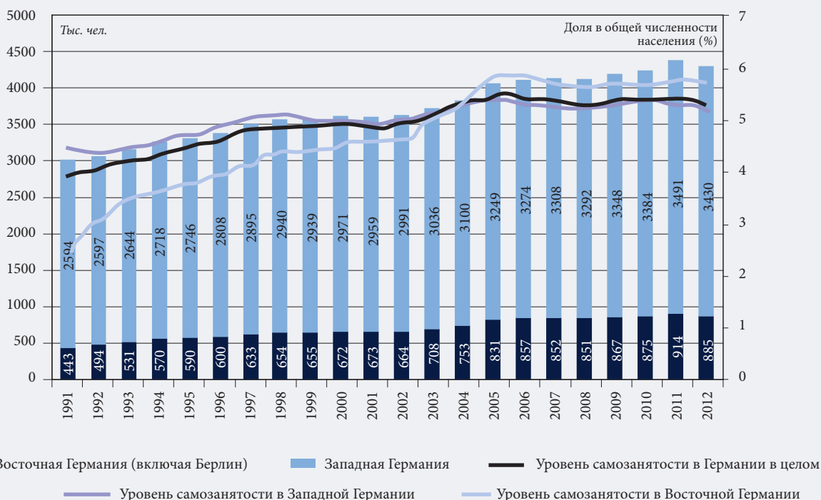
Рис. 1. Динамика показателей самозанятости в Германии (1991–2012)

Источник: расчеты автора на основе данных германской микропереписи.